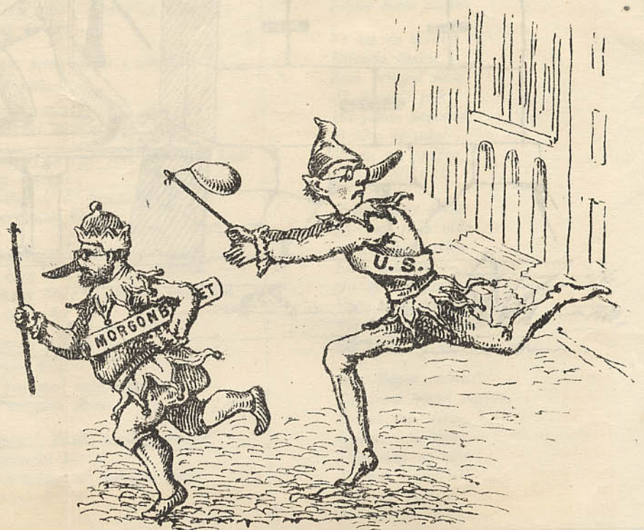
Dagen efter dagen.