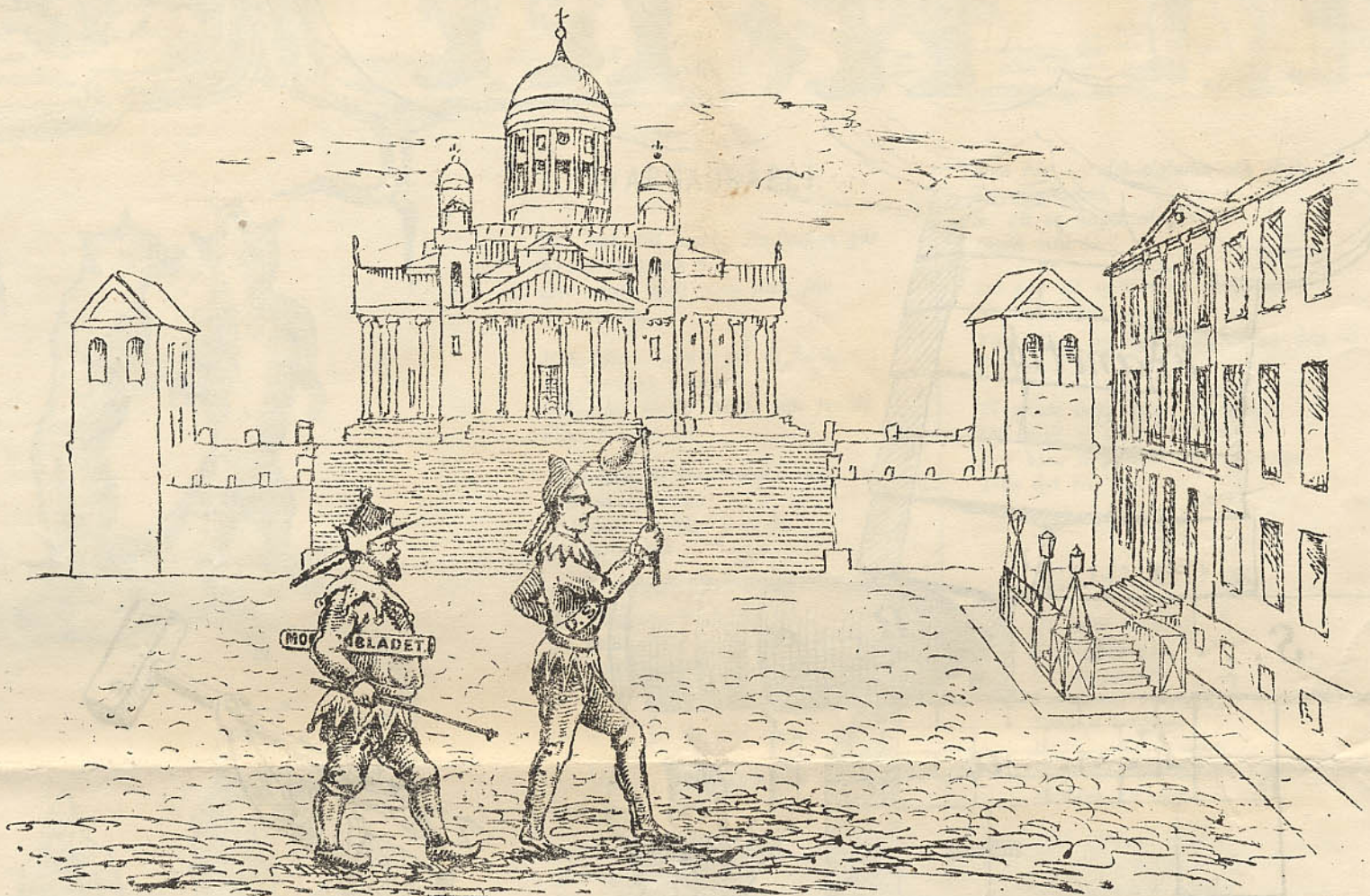
Dagen före dagen.