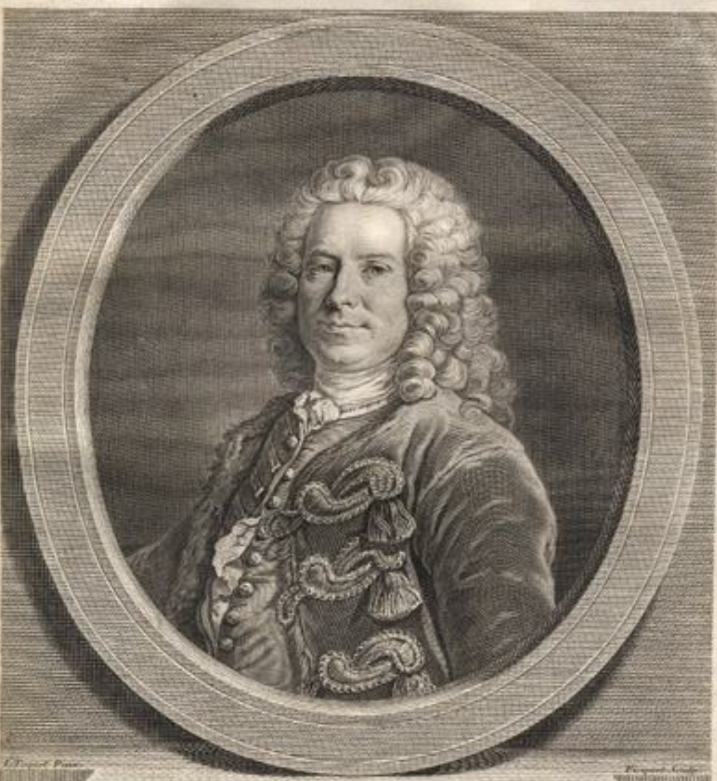
JEAN JACQUES DORTOUS DE MAIRAN.