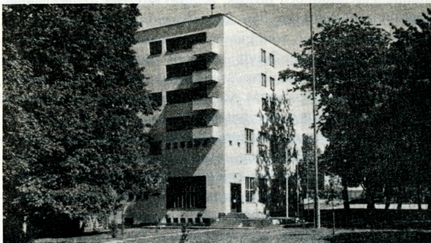
Åbo Akademis bibliotek, uppfört 1935

och folkliv. Samtidigt kunna många problem lösas, som äro av både fosterländskt och skandinaviskt intresse. Det är ofta problem, som äro av direkt betydelse även för finsk och rikssvensk forskning. Det samarbete, som därmed konkretiseras, är typiskt för de kontakter både åt öster och väster, som ådagalägga Akademiens säregna ställning i nordiskt kulturliv. Att de här nämnda professurerna jämte den angivna gemensamma uppgiften ha sina egna immanenta — självständiga och vida — syften, behöver icke sägas.