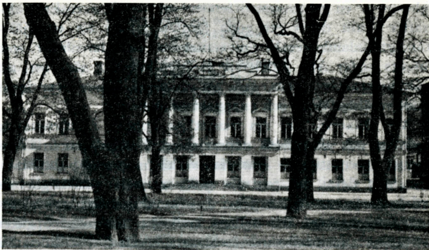
Åbo Akademis huvudbyggnad, uppförd 1833

sant: när nya professorer upprättats på grund av enskilda donationer och deras ämne i många fall bestämts av donator eller tillfälliga inflytelser, har icke Akademien själv nog målmedvetet och kritiskt kunnat bestämma utvecklingen. En överblick över vår högskolas nuvarande undervisningsprogram visar emellertid, att detta icke är så disparat, som det kunde förefalla, och att professorerna i allmänhet äro samlade kring vissa centra. Fyra sådana komplex kunna iakttagas.