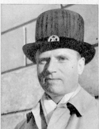
DR SLÄTIS tillhör också den stora akademistaten, c:a 50 lärare, 25 tjänstemän.