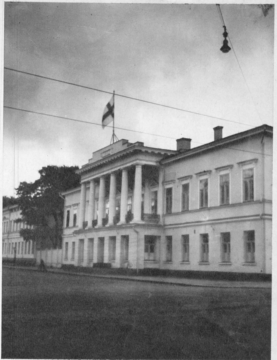
ETT ENKELT VITT STENHUS vid Braheparken inrymmer Åbo Akademi. Huset byggdes 1833 och är sålunda ganska färskt. Traditionen är i stället 300 år gammal. Över fasaden vajar den blåvita flaggan och i parken står Per Brahe omgiven av gamla träd i domkyrkans skugga.