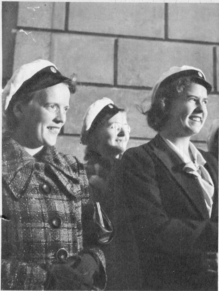
INSKRPTIONEN blev år 1940 något högtidligare än vanligt, ty akademien fyller ju 300 år i år. På grund av de politiska händelserna firades icke detta jubileum på det sätt man från början tänkt sig. Studentskorna voro trots tiderna besjälade av den rätta optimismen.